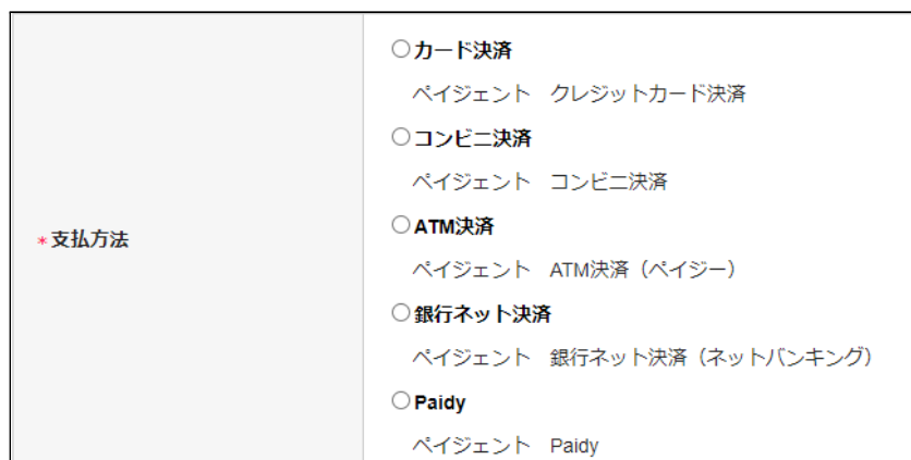
フロント > 発送・支払方法 > 支払方法の選択