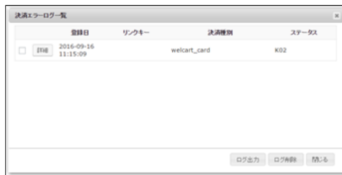
決済エラーログ一覧

「決済エラーログ」をクリックすると、エラーログの一覧が表示され、いつどのようなステータスでエラーが発生したかを確認できます。エラーを確認したら、不要なエラーログを全て削除してください。