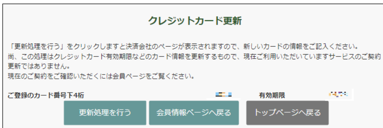
クレジットカード変更はこちら > カード情報入力確認画面