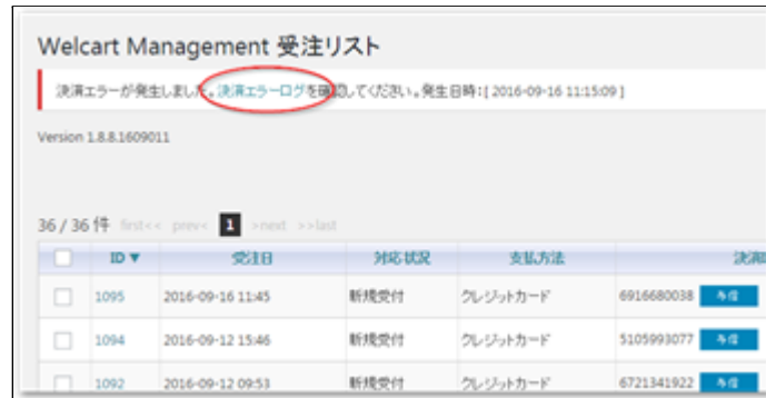
管理画面 決済エラー発生告知

決済時にエラーが発生すると、管理画面では決済エラー発生のお知らせが表示されます。このメッセージは、エラーログがすべて削除されるまで表示し続けます。