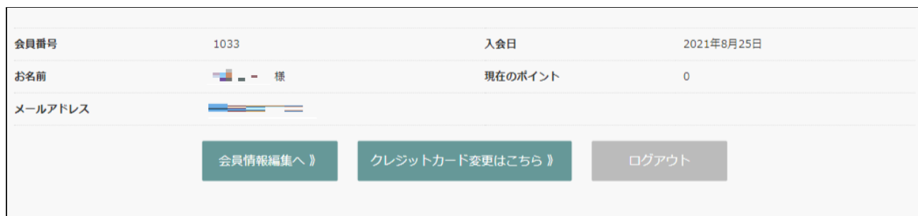
ペイクイック決済を利用している場合の会員のマイページ

ルミーズでペイクイック決済を利用している場合、Welcart 会員はマイページからカード情報の変更ができます。